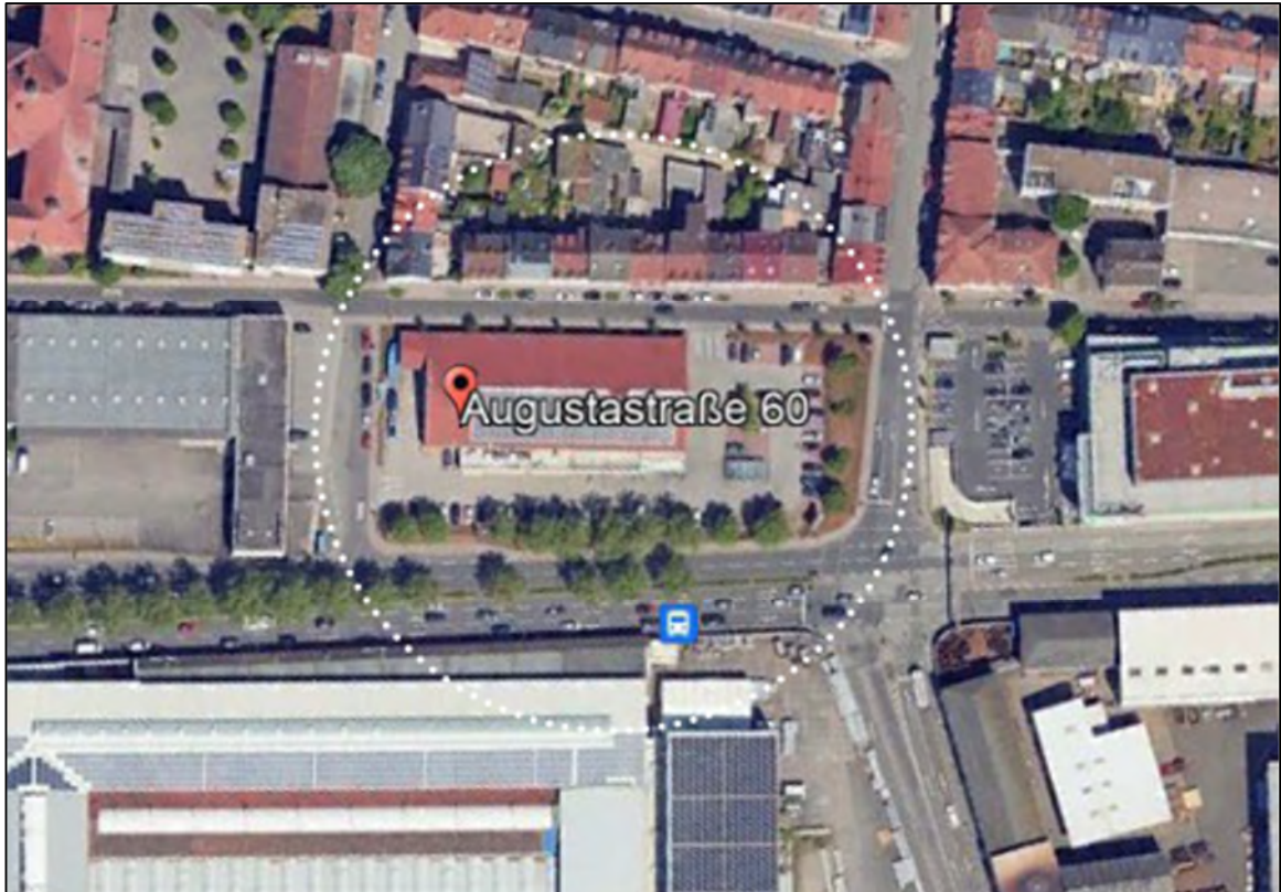
Abb.1: Luftbild zum Untersuchungsgebiet

Im Süden grenzt an die Bundesstraße B 37 ein Industriegebiet (GI) an, welches ebenfalls im Geltungsbereich des Bebauungsplans ‚Südtangente Teilplan Ost‘ liegt.