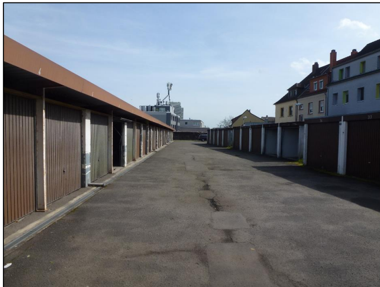
Abb. 4: Sicht auf das Garagenareal