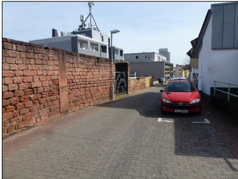
Abb. 3: Sicht auf die Mauer in der Turnerstraße