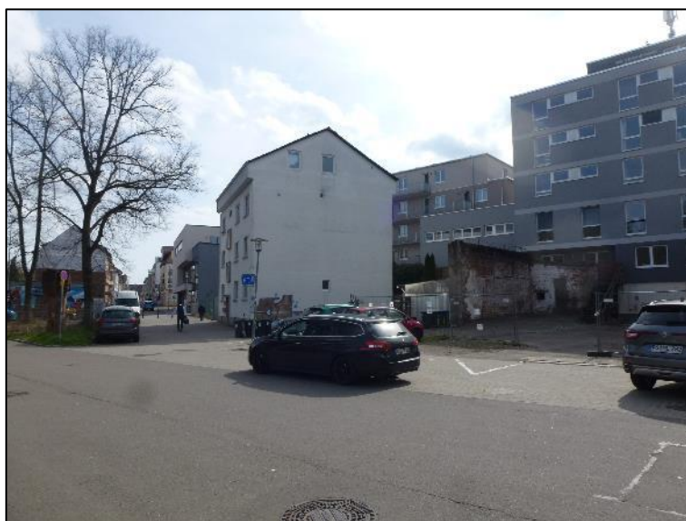
Abb. 5: Sicht auf die Lage an der Schoenstraße