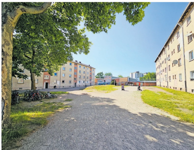
Blick zwischen die beiden Blöcke der Flüchtlingsunterkunft im Aternweg, die gemäß dem neuen Konzept bis 2030 leer sein sollen

Bereits seit einigen Jahren arbeitet das Sozialreferat der Stadt gemeinsam mit dem Referat Gebäudewirtschaft an einer umfassenden neuen Gesamtkonzeption für den Umgang mit Wohnungslosigkeit und Obdachlosigkeit, dem sogenannten Drei-Säulen-Modell. Ausgehend vom 1. Runden Tisch Wohnen, der im Februar 2023 stattfand, wurden drei Themen-