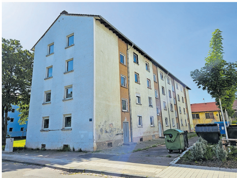
Der letzte unsanierte Block im Geranienweg (Nr. 23-29) soll bis 2029 saniert sein

Im Aternweg werden über 200 Mietwohnungen entstehen. Das Gebiet der Blöcke Aternweg 7-15, 27-35, 37-43, 45-53 soll leergezogen und im Zuge einer Gebietsentwicklung mit sozialgeförderten Mietwohnungen (100 %) neu bebaut werden. Geplant und realisiert werden die Neubauten von der städtischen Wohnungsbaugesellschaft Bau AG. Die 200 Mietwohnungen übersteigen den aktuellen Bedarf vor Ort, so dass ein Großteil der Wohnungen anderweitig vermietet werden kann. Eine Besonderheit ist das Gebäude mit den Hausnummern 1-5. Es soll im Zeitraum des Neubaus vorerst bestehen bleiben und wird danach saniert werden, so dass die dortigen Wohnungen zukünftig ebenfalls als Mietwohnungen zur Verfügung stehen.