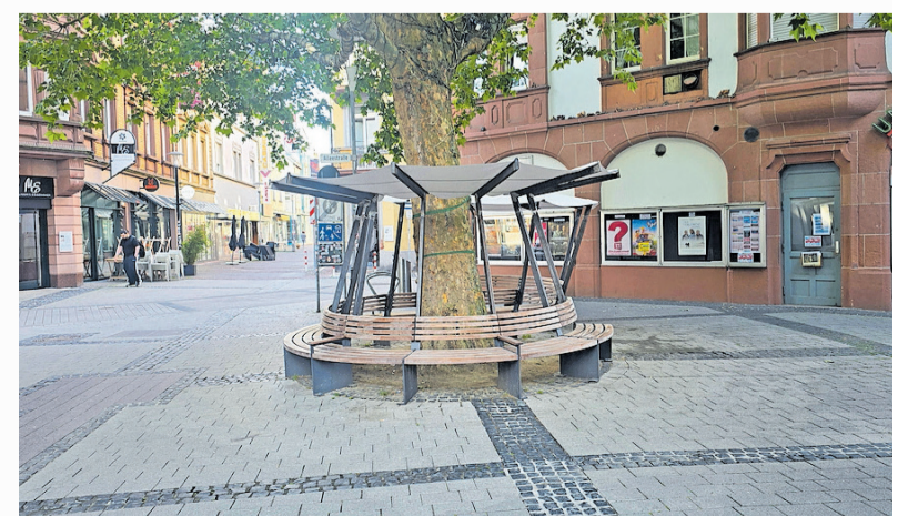
Über der Bank wurde vor wenigen Tagen ein Dach installiert, um sie vor dem Kot zu schützen

Kürzlich wurden in der Innenstadt mehrere tote Jungvögel gefunden.