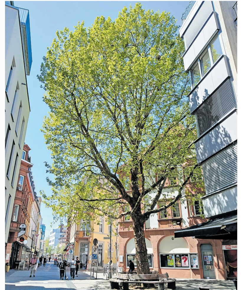
Der von Krähen besiedelte Baum am Union-Kino Ende April

Oft führten Gegenmaßnahmen dazu, dass sich die Kolonien anschließend aufteilten und neue sogenannte Splitterkolonien an anderen, möglicher-