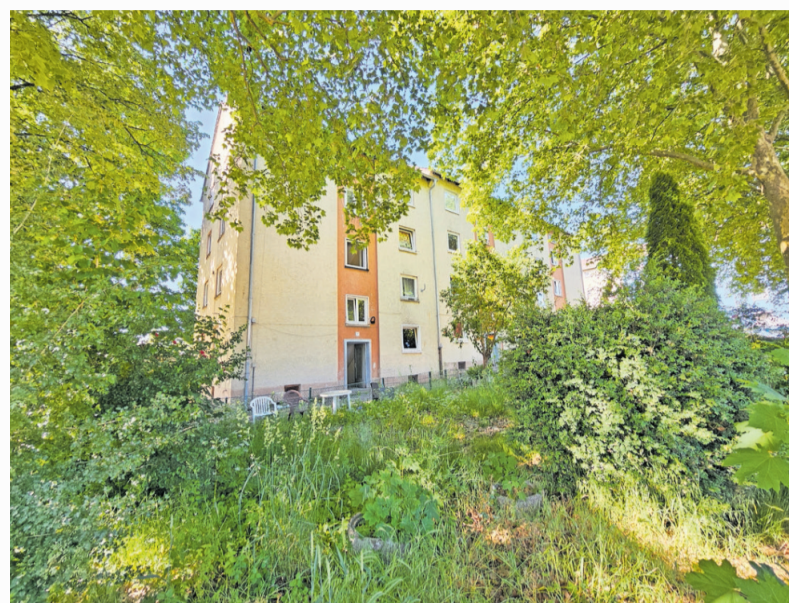
Der Block im Aternweg an der Ecke zur Mennonitenstraße (Nr. 1-5) soll als einziger erhalten und saniert werden

Die Stadt versucht immer, Obdachlosigkeit zu verhindern, und ist gesetzlich verpflichtet, im ordnungswidrigen Sinne unfreiwillig obdachlose Personen unterzubringen. Konkret bezieht sich dies auf Menschen, die ihre Wohnung durch eine Zwangsräumung oder durch höhere Gewalt wie etwa einen Wohnungs-