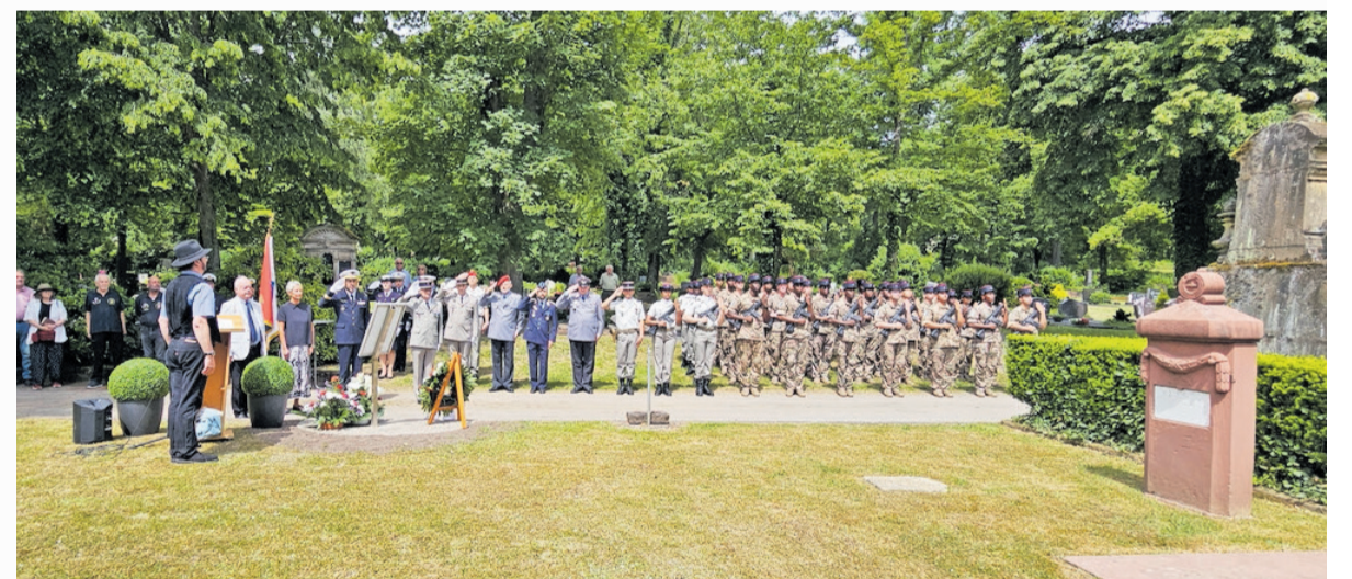
Auf dem Foto rechts zu sehen ist einer der beiden Grabsteine mit asiatischen Schriftzeichen, die den Anstoß für die Recherche gegeben hatten

Das vollständige Ferienprogramm und alle Details zur Ferienbetreuung sind online unter www.kaiserslautern.de/ferienprogramm verfügbar. Bei Fragen steht das Jugendhaus unter der Telefonnummer 0631 3652680 oder -2689 zur Verfügung. |ps