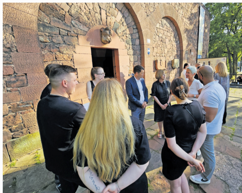
Nach der Ehrung traf man sich vorm Casimirschloss zum lockeren Austausch

Ehrung der Jungmeisterinnen und Jungmeister im Casimirschloss