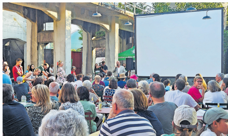
Etwa 200 Gäste kamen bei sommerlichen Temperaturen zum Fahrradkino im Kohlenbunker