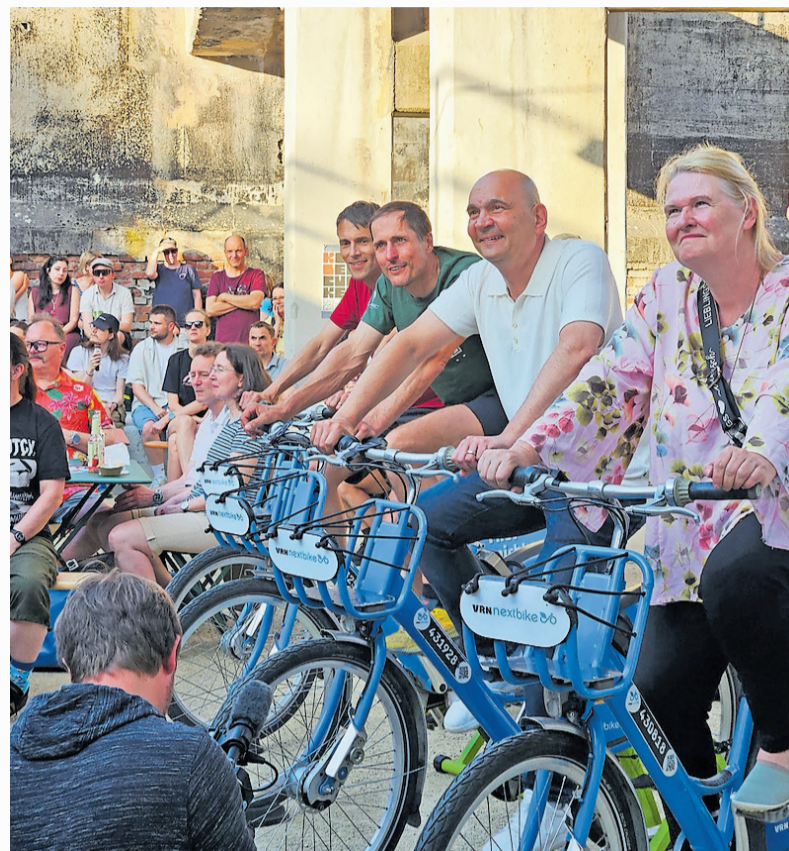
Bürgermeister Manfred Schulz (2.v.r.) trat zu Beginn der Veranstaltung auch selbst kräftig in die Pedale, gemeinsam mit Mitgliedern des Stadtrats

Aufgrund des hervorragenden Wetters und der daher zu hell ausgeleuchteten Leinwand musste der Be-