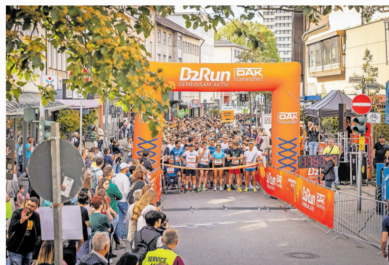
In den letzten Jahren war die Innenstadt noch Schauplatz für den Firmenlauf. In diesem Jahr wird das Fritz-Walter-Stadion im Mittelpunkt stehen.

Teilnehmende im Rollstuhl oder mit Handicap sollten für diesen Rundkurs Unterstützung von mindestens einer sportlichen Begleitperson erhalten. Alternativ steht eine barrierearme Streckenvariante mit einer Länge von etwa 1,5 Kilometern zur Verfügung. Ein besonderes Highlight für alle ist der Zieleinlauf im Stadion – ein Mo-