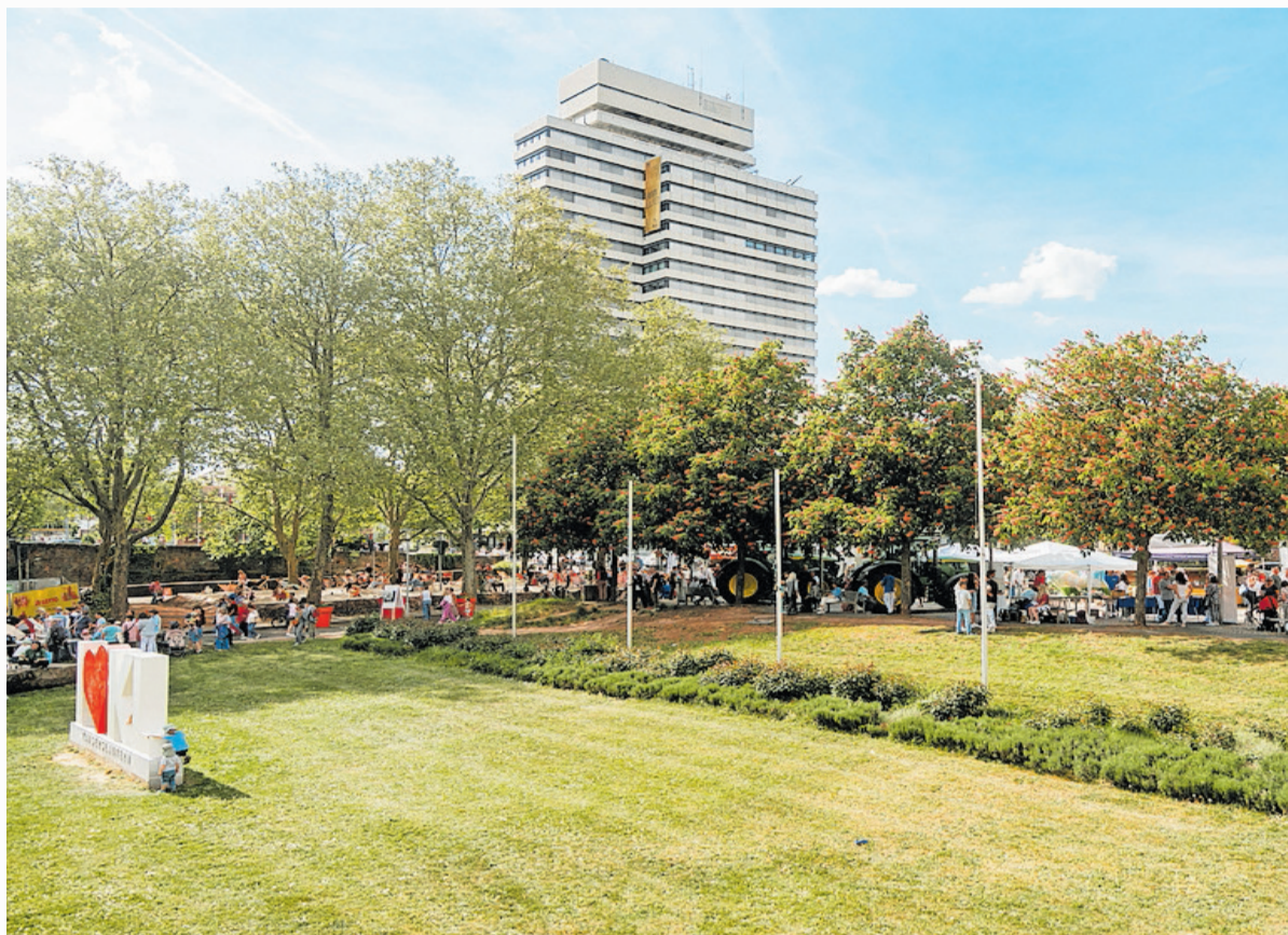
Bei der Kultursommereröffnung am ersten Maiwochenende ließ sich erahnen, wie gut eine Belegung des Areals bei den Bürgerinnen und Bürgern ankommen würde.

So müssen vor einer etwaigen Umnutzung des Parkhausdaches bauliche, eigentumsrechtliche wie planungsrechtliche Fragen geklärt werden; bei einer Überplanung des Rathausvorplatzes wiederum sind hohe Hürden allein aufgrund des Denkmalschutzes beachten. Vor allem aber wird eine Masterplanung des kom-