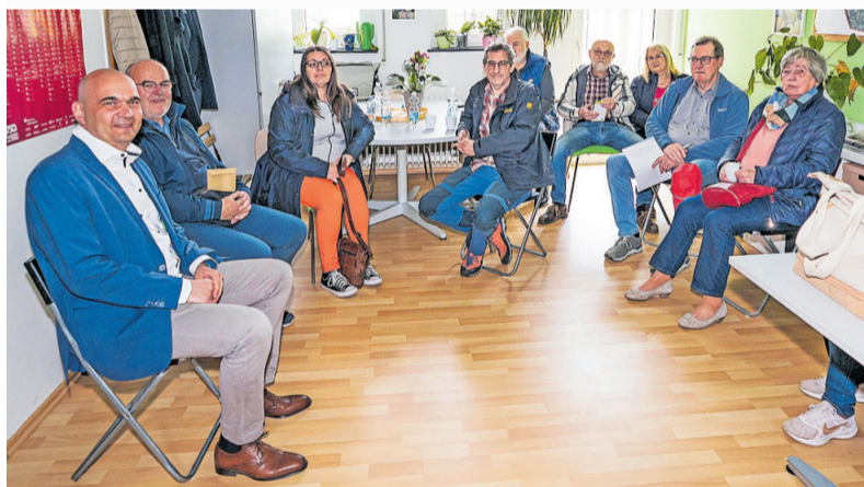
Die erste Bürgersprechstunde des Bürgermeisters (links) war gut besucht

Der Termin im Stadtteilbüro Innenstadt-West fand am 23. April statt. |ps