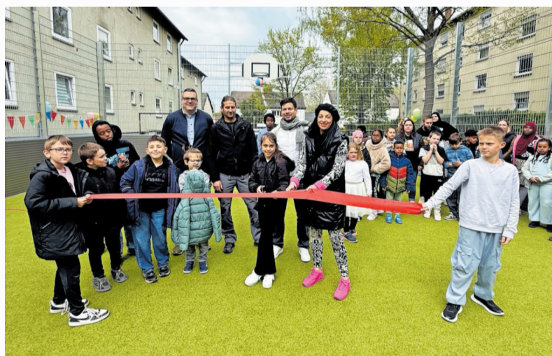
Einweihung der Kleinfeldspielanlage bei der Rappelkiste

Im Laufe der vergangenen Jahrzehnte wurde die Einrichtung kontinuierlich erweitert und konzeptionell weiterentwickelt. Ein besonderer Schwerpunkt liegt dabei auf einer qualitativ hochwertigen pädagogischen Arbeit sowie einer starken sozialraumorientierten Ausrichtung. Aktuell werden insgesamt 60 Kinder zwischen 6 und 14 Jahren betreut. Mit dem neuen Kleinspielfeld wurde nun ein weiterer Meilenstein erreicht. Das Spielfeld, das vollständig durch Sponsoren finanziert wurde, bietet Kindern und Jugendlichen im Wohngebiet deutlich verbesserte Möglichkeiten für Bewegung, Spiel und Begegnung. Es stellt eine wertvolle Ergänzung des bestehenden Angebots dar und trägt zur weiteren Aufwertung des sozialen Umfelds bei.