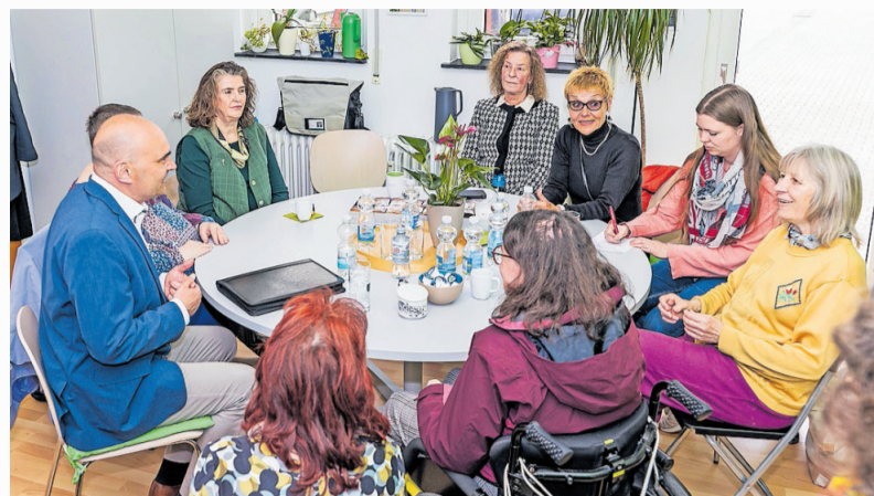
Zu Beginn erzählten die Ehrenamtlichen im Stadtteilbüro Grübentälchen Bürgermeister Manfred Schulz (links) von ihren zahlreichen Angeboten

Anschließend wurde das Stadtteilbüro für die Bürgerinnen und Bürger geöffnet. 13 Interessierte nahmen die Sprechstunde des Bürgermeisters wahr. Die drei Hauptthemen des Nachmittags waren Sauberkeit, der Straßenverkehr und die Parkraumsituation. So wurde von illegalen Müllablagern im Stadtteil berichtet. Manfred Schulz berichtete, dass der Handlungsbedarf bereits erkannt worden sei. „Die steigende Zahl der illegalen Müllablagern ist ein großes Problem. Wir möchten ein