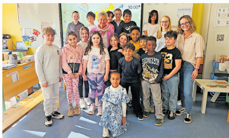
Oberbürgermeisterin Beate Kimmel mit der Klasse 3a

Im Rahmen ihrer Reihe „Hallo Oberbürgermeisterin!“ besucht oder empfängt Beate Kimmel in unregelmäßigen Abständen Grundschülerinnen und Grundschüler. Weitere Informationen gibt es per E-Mail an bildungsbuero@kaiserslautern.de oder telefonisch unter 0631 3652352. Bei Interesse nimmt das Bildungsbüro auch Bewerbungen für das Format gerne entgegen.