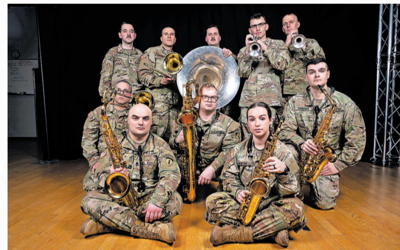
Die Rhine River Ramblers der US Army bestreiten am 8. Mai das Eröffnungskonzert

Alle Infos zur Jubiläumsbühne sind in Kürze zu finden unter www.750kl.de .