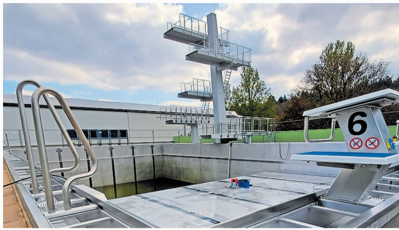
Das neue Edelstahl-Springerbecken im Warmfreibad während der Reinigung am 14. April

Derzeit sieht es gut aus für einen pünktlichen Saisonstart der beiden städtischen Freibäder Mitte Mai. In der Waschmühle wurde nach Ablassen des Wassers im März das Becken gereinigt, seitdem laufen die üblichen Arbeiten zur vorsaisonalen Instandsetzung des Beckens, der Wege und der Gebäude – alles bislang reibungslos. Im Becken wurden unter anderem Dehnfugen und Dichtbänder repariert und eine Betonsanierung durchgeführt. Besonders positiv ist zu erwähnen, dass die schrägen Sprunggrubenwände keine Hebungen zeigten, was in der Vergangenheit oft der Hauptgrund für den verzögerten Saisonstart war. Dies deutet daraufhin, dass die in den vergangenen Jahren eingebauten Flutventile funktionieren und offensichtlich den Druck des Grundwassers zuverlässig abbauen. Seit dieser Woche wird das Wasser eingelassen. Danach dauert es wie immer noch ungefähr drei Wochen bis zu einer möglichen Öffnung.