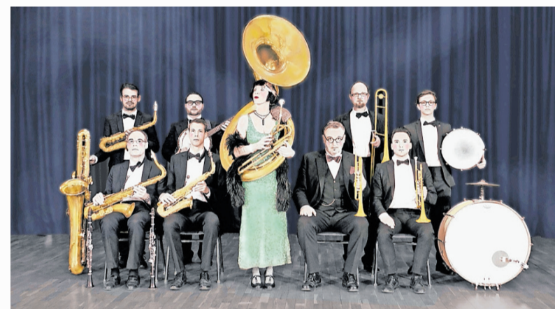
Das beliebte Kareol Tanzorchester bringt am Samstagabend in der Fruchthalle die Roaring Twenties zurück

Spektakulär wird der Blick auf die Rathausfassade: Das 22-stöckige Gebäude dient dabei als vertikale Bühne für Artistik des Bencha Theaters (NL). Zweimal (um 14 und um 16 Uhr) kann das Publikum hier atemberaubende