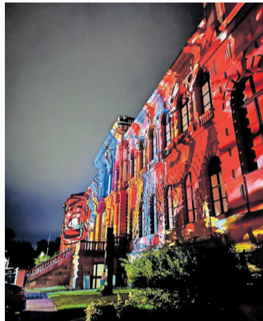
Das Museum Pfalzgalerie ist der nördliche Ausgangspunkt der Kulturmeile am 2. Mai

Am und im Pfalztheater bietet sich am „Goldene 20er Tag“ ein riesiges