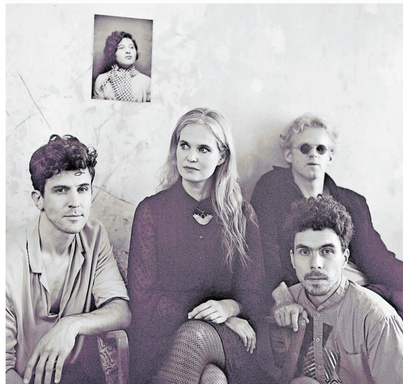
Ein besonderes Highlight ist das Konzert von DOTA & Band im Pfalztheater

Schon wenige Meter weiter trifft man auf großformatige Fahnen und Leuchtkästen an der Fassade der BBS II: eine Installation von Schülerinnen und Schülern mit Unterstützung des Fotografen Thomas Brenner unter dem Titel „Golden Reloaded: Damals. Heute. Wir.“ Gegenüber lädt das Al-