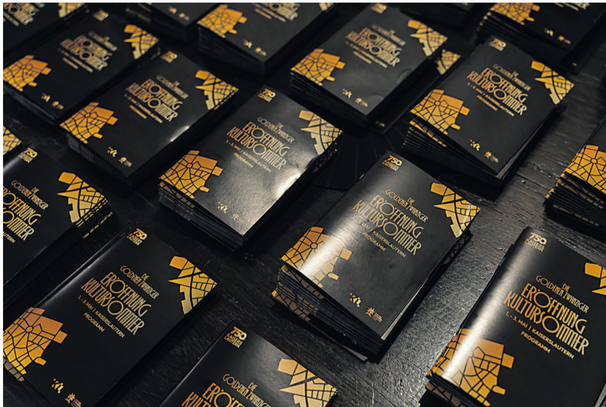
Das frisch gedruckte Programmheft ist seit Ende letzter Woche im Stadtgebiet erhältlich