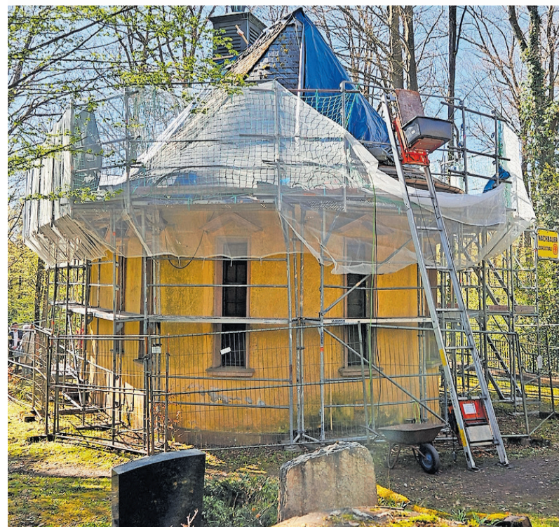
Das Gerüst um die Kapelle steht und die Arbeiten am Dach haben begonnen.