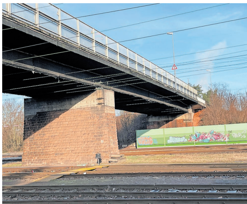
Die alte, 1961 erbaute Brücke wird demnächst ersetzt

Wenn es dann richtig los geht im Mai 2029, wird die alte Brücke nicht einfach abgerissen, sondern auf Rollen weggeschoben und dann abseits der Gleise auseinandergenommen. In