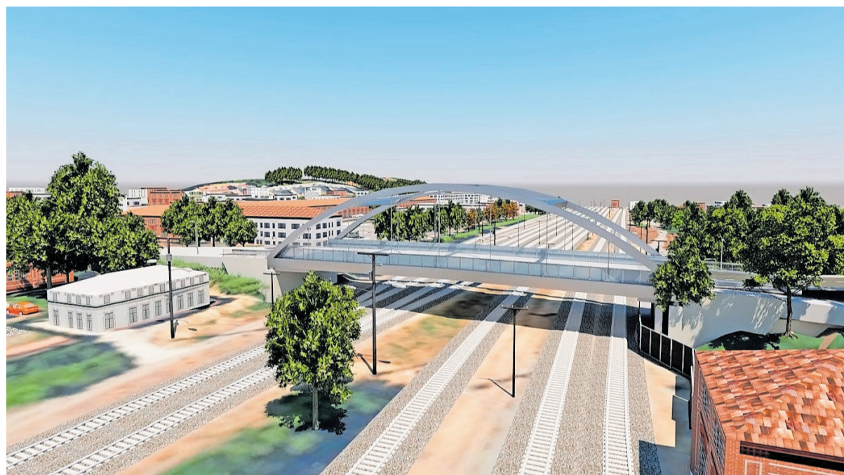
So wird die neue Stabbogenbrücke einmal aussehen

Herausgeber: Stadt Kaiserslautern Redaktion Pressestelle: Matthias Thomas (V.i.S.d.P.), Viktoria Schneider, Sandra Janik-Sawetzki, Charlotte Lisador, Sandra Zehle, Tel. 0631 365-2206, E-Mail: amtsblatt@kaiserslautern.de Die Beiträge der Fraktionen und Gruppierungen des Gemeinderates stehen rechtlich in ihrer eigenen Verantwortung. Verlag: SÜWE Vertriebs- und Dienstleistungsgesellschaft mbH & Co. KG E-Mail: amtsblatt-kaiserslautern@suwe.de Druck: DSW Druck- und Versanddienstleistung Südwest GmbH & Co. KG, 67071 Ludwigshafen, E-Mail: info@oggersheimer-druckzentrum.de Verteilung: PWG Ludwigshafen, E-Mail: zustellklausur@suwe.de oder Tel. 0621 572 490-60 Das AMTSBLATT KAISERSLAUTERN erscheint wöchentlich freitags außer an Feiertagen. Das AMTSBLATT KAISERSLAUTERN wird kostenlos an alle erreichbaren Haushalte in Kaiserslautern verteilt. Sofern eine Zustellung des Amtsblattes aufgrund von unvorhersehbaren Störungen nicht erfolgt sein sollte, kann das jeweils aktuelle Amtsblatt im Rathaus abgeholt werden.