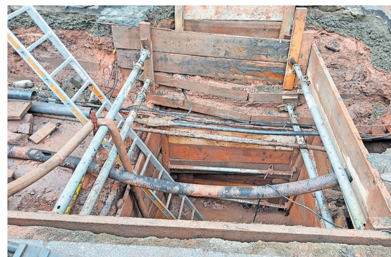
In der neuen Stadtmitte laufen zahlreiche Leitungen zusammen. Hier ist das Arbeiten nur unter erschwerten Bedingungen möglich.