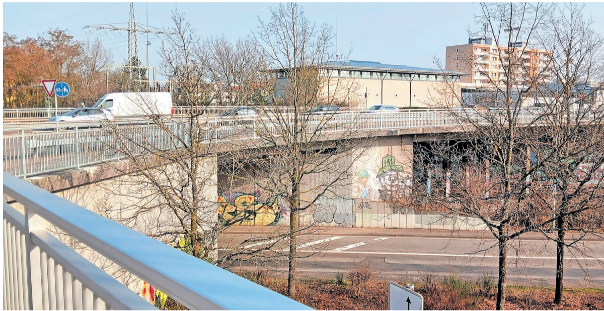
Die Brücke in der Pariser Straße überspannt die Brandenburger Straße und die Bahnlinie. Blick aus Richtung Rauschenweg.

Aktuell laufen nun weitere Untersuchungen, wie man mit der 72 Jahre alten Brücke und ihren Wehwechen umgeht. Eine Verkehrszählung soll Aufschluss geben über die konkreten Belastungen. Zwei Sensoren an den Lagern sollen zusätzlich für Sicherheit sorgen. Ungewöhnliche Bewegungen der Brücke würden sofort erfasst und sofort gemeldet werden – etwa wenn sich das Bauwerk infolge Lagerversagen leicht absenkt. Eine Wirtschaftlichkeitsberechnung soll durchgeführt werden, um zu ermitteln, ob ein Neubau schon jetzt wirtschaftlicher wäre als kontinuierliche Instandsetzungsmaßnahmen, durch die man die Brücke bis ans Ende ihrer Restnutzungsdauer verkehrstüchtig halten könnte. |ps