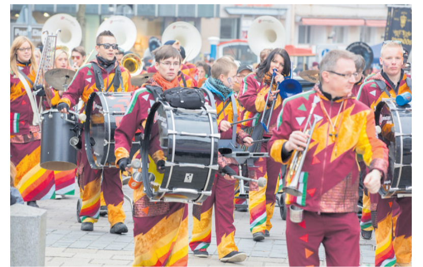
Auch zahlreiche Musikgruppen werden wieder in der Innenstadt unterwegs sein

Ob Genussmarkt, Musik, Shopping, der Französische Markt in der Kerstraße oder Familienprogramm – „Lautern blüht auf“ bietet für Groß und Klein viele Gründe, den Frühling gemeinsam in der Kaiserslauterer Innenstadt zu feiern. Ein besonderer