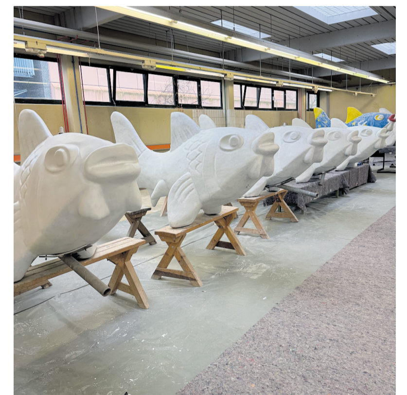
Die Fische werden an der BBS 1 derzeit für das neue Design vorbereitet

Daennerstrasse 11 • 67067 Kaiserslautern • Tel.: 0631/365-1700 • E-Mail: kundenservice@stadtbildpflege-kl.de • www.stadtbildpflege-kl.de