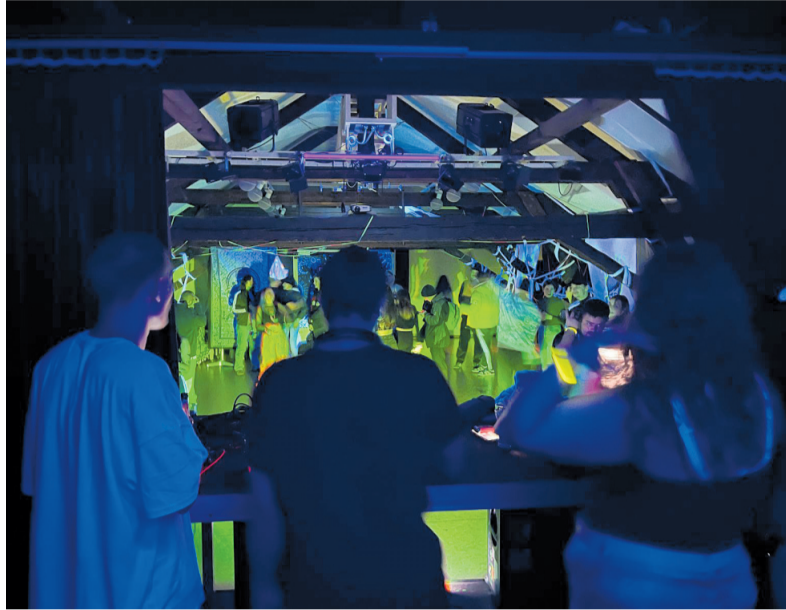
Das Jugend-Rave im letzten Jahr war gut besucht

Ein Rave ist eine Musik- und Tanzveranstaltung, bei der elektronische Musik im Mittelpunkt steht. Raves stehen für Gemeinschaft, Kreativität und das gemeinsame Erleben von Musik und Bewegung. Mit der Veranstal-