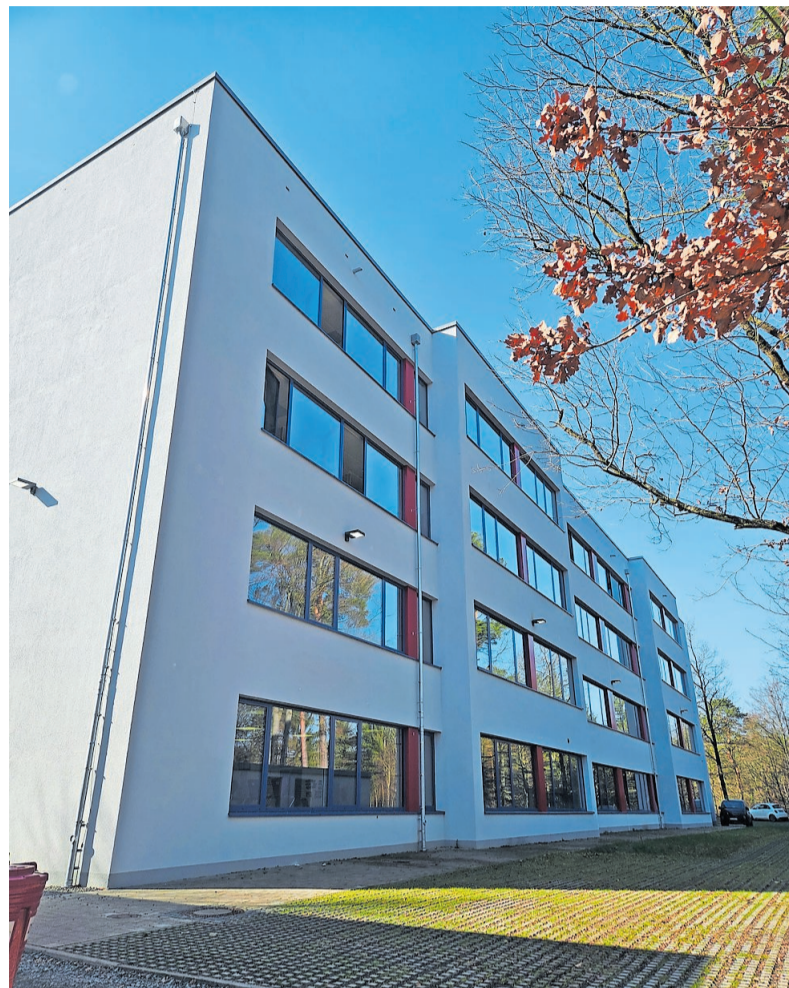
Das neue Schulgebäude grenzt direkt an den Pfälzer Wald